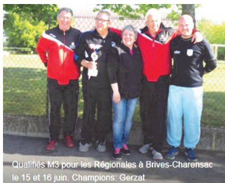
Qualifiés M3 pour les Régionales à Brives-Charensac le 15 et 16 juin. Champions: Gerzat