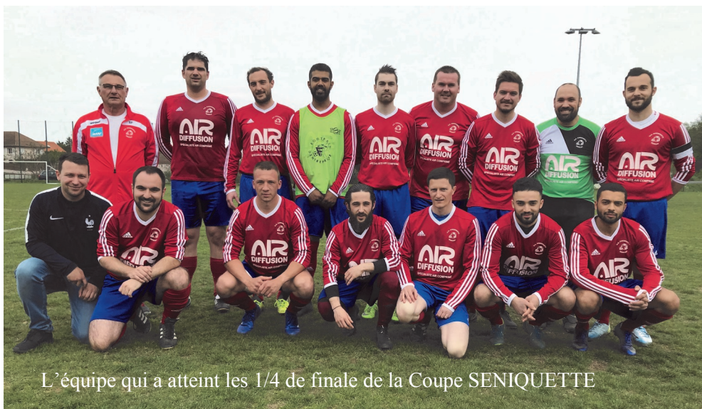
L'équipe qui a atteint les 1/4 de finale de la Coupe SENIQUETTE

Les entraînements reprendront le 26 Août avec un effectif qui s'annonce intéressant compte tenu des recrues attendues.