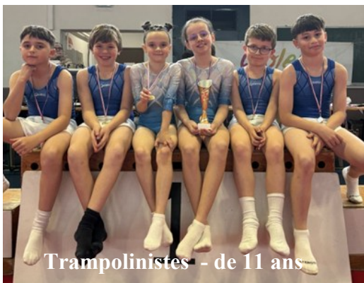
Trampolinistes - de 11 ans

Ces 4 jeunes se sont qualifiés pour la Finale Nationale qui aura lieu les 6 et 7 juin à Clermont-Ferrand.