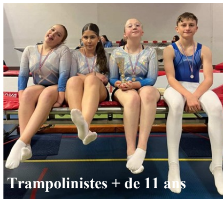
Trampolinistes + de 11 ans