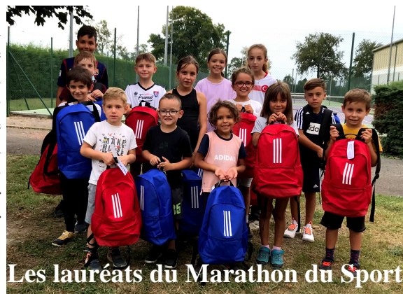
Les lauréats du Marathon du Sport

L'après-midi a connu également une belle affluence même si on ressentait une certaine frilosité dans le public qui a quand même répondu présent pour rencontrer les clubs et finaliser de nombreuses adhésions.