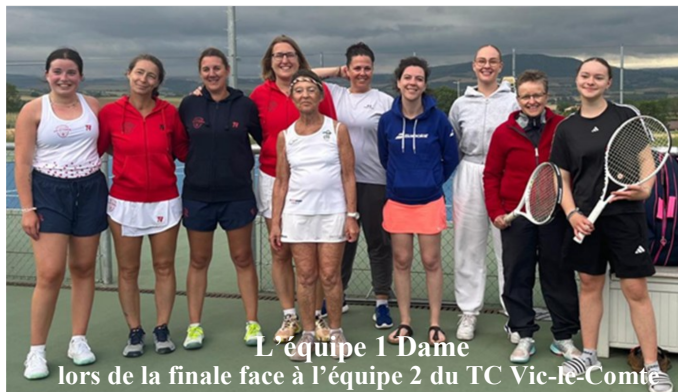
L'équipe 1 Dame lors de la finale face à l'équipe 2 du TC Vic-le-Comte