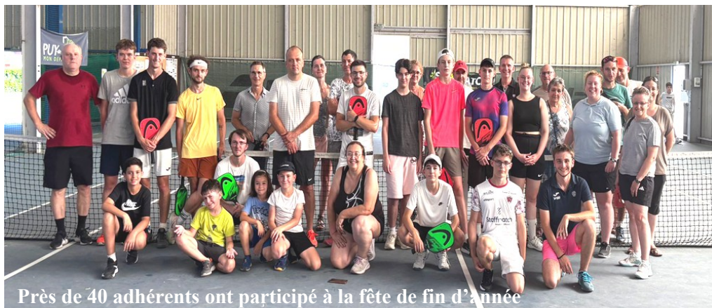
Près de 40 adhérents ont participé à la fête de fin d'année

Merci à tous les adhérents qui ont participé à ce bon moment et aux bénévoles pour l'organisation !